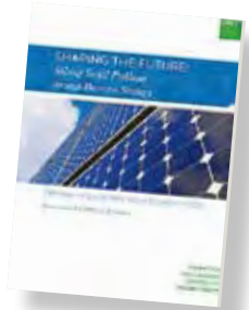
Rapport Shaping the future

Cela s'explique par une augmentation de 16 % des contributions non-matérielles des entreprises, telles que le mécénat de compétences ou les services pro bono . Cette étude révèle également que l'effet de crise incite fortement les entreprises à privilégier une ou deux problématiques sociétales centrales plutôt qu'un émiettement de leurs fonds.